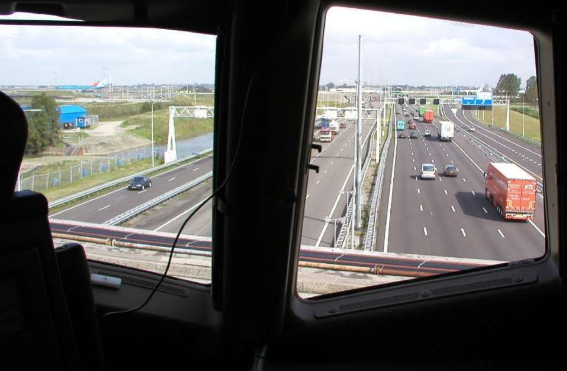
Taxiando sobre viaduto em Los Angeles.