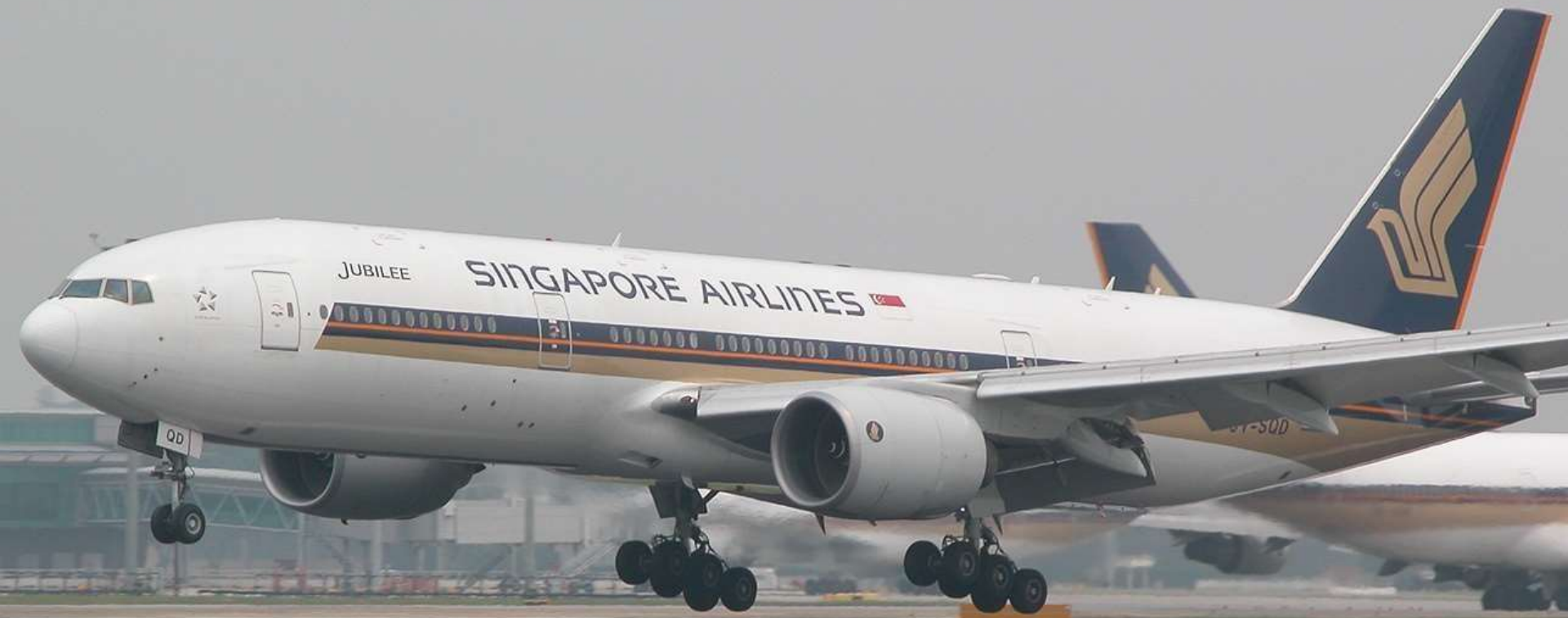
Pouso "ON TIME" na pista 07L de KLAX (Los Angeles)