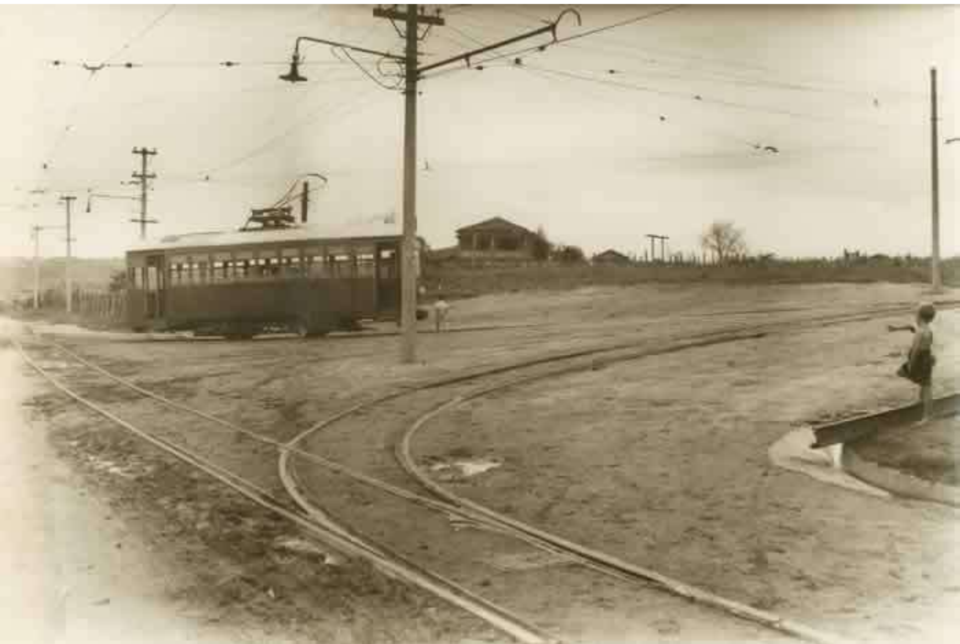
EM MANOBRAS NA R. CÉL. NOGUEIRA PADILHA (Adicionada à este arquivo)