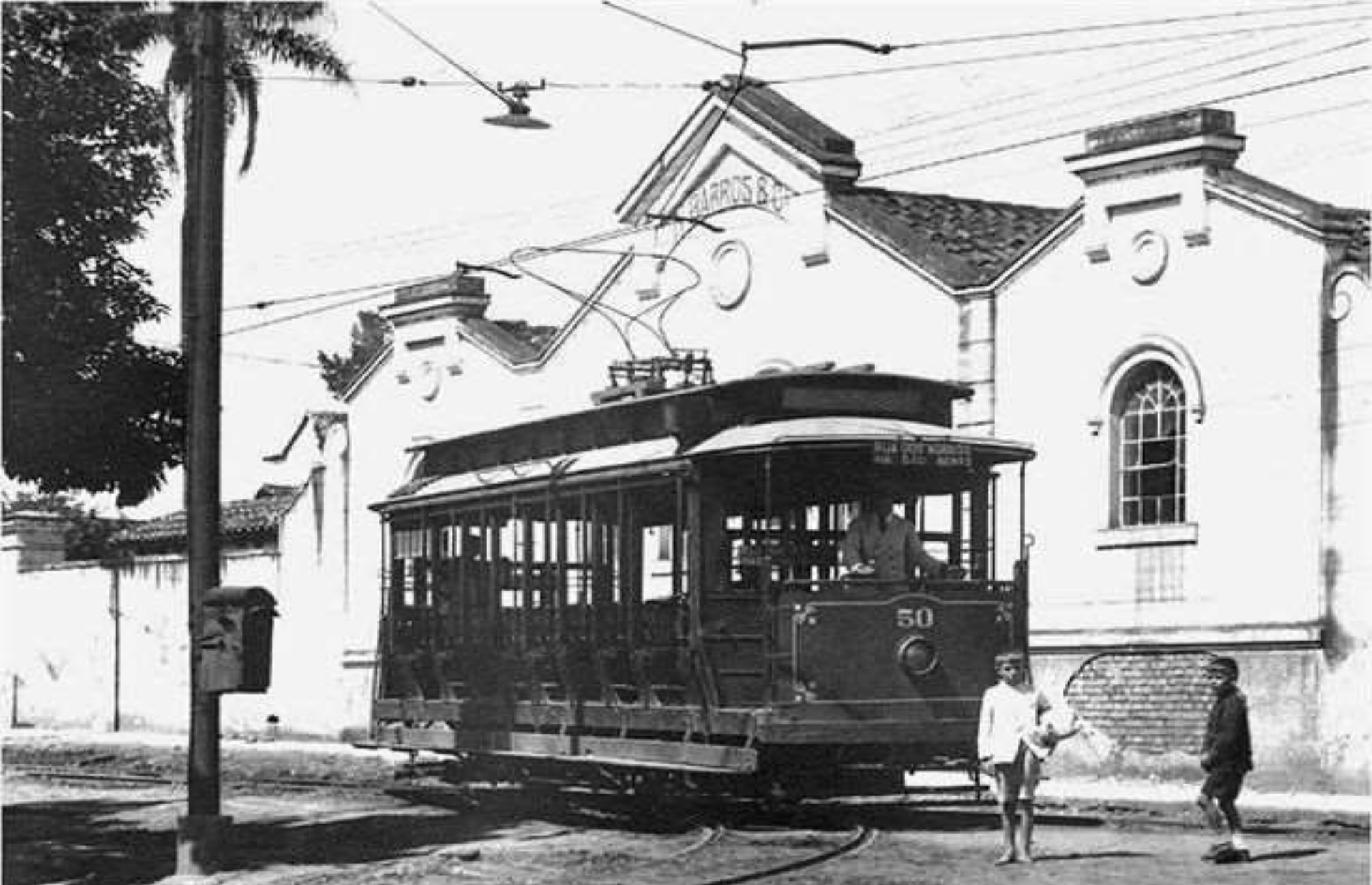
Praça Arthur Fajardo