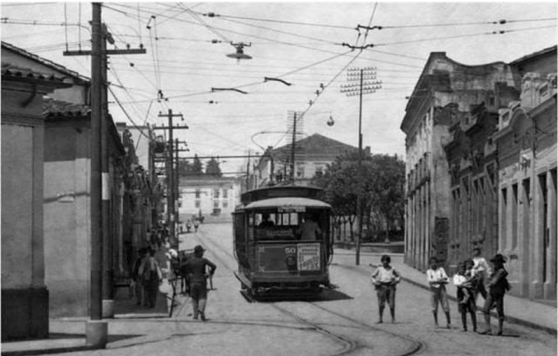
1924 - Rua de São Bento Centro