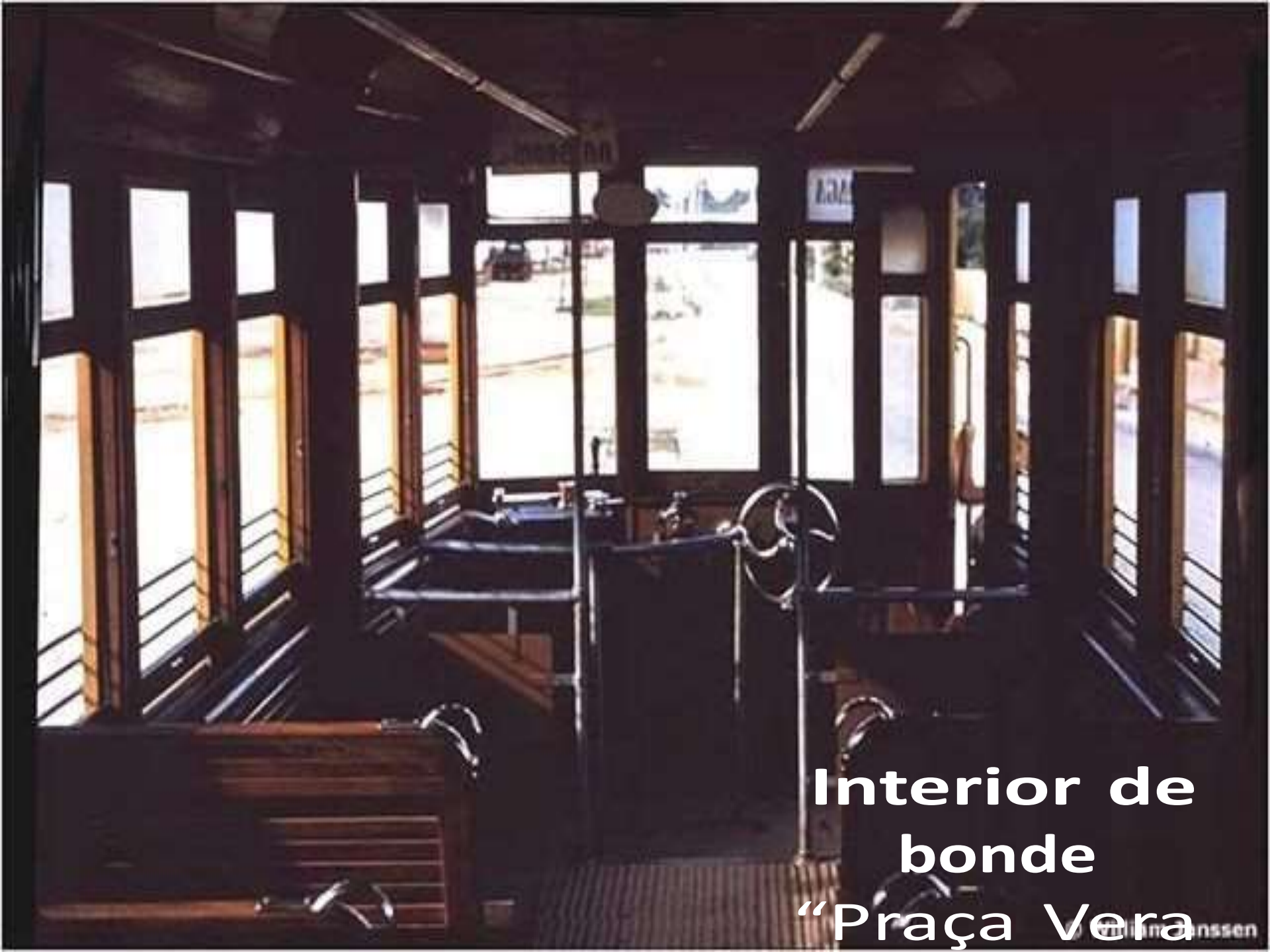
Interior de bonde "Praça Vera