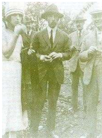
A foto com Santos Dumont, usada da capa da revista.