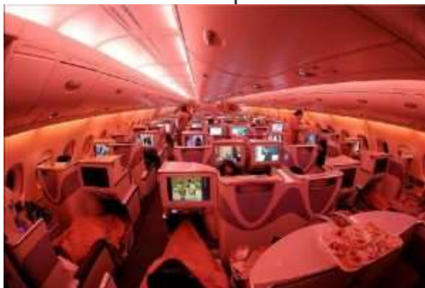
Classe business em um A380 da Emirates, localizada no andar superior.