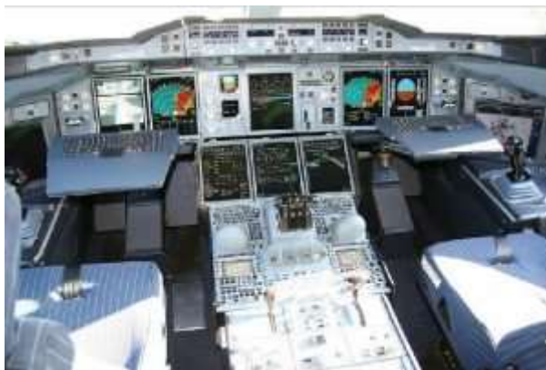
O exuberante cockpit da aeronave.