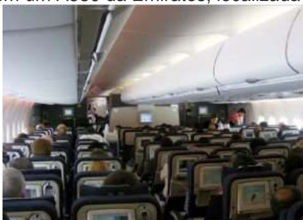
Classe econômica de um A380 da Air France, localizada no andar intermediário.