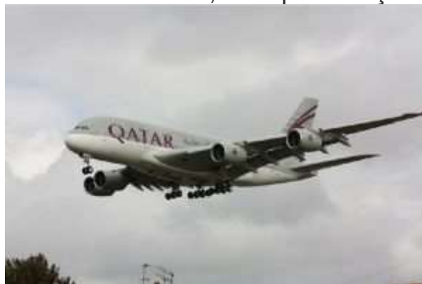
Um A380 da Qatar Airways em aproximação final.