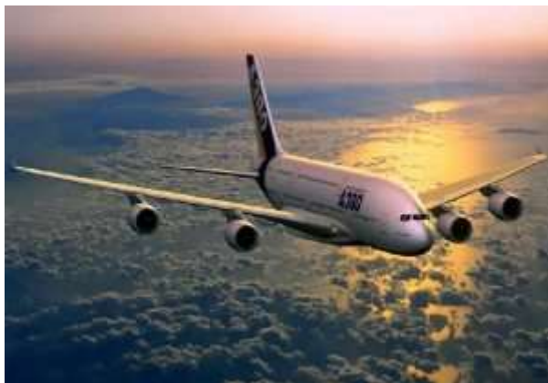
O voo do gigante.