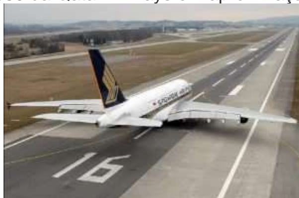
Um A380 da Singapore Airlines em preparação para decolar.