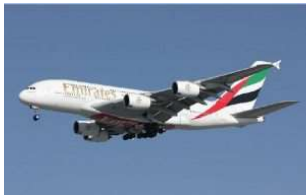
Um A380 da Emirates, em aproximação final.