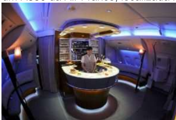
Bar em um A380 da Emirates.